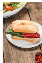
Sugestão de apresentação