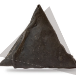
Choco e Lulas