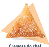
Cremosa do chef