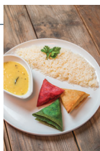
Sugestão de apresentação