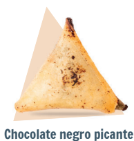
Chocolate negro picante