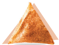
Tarte de maçã